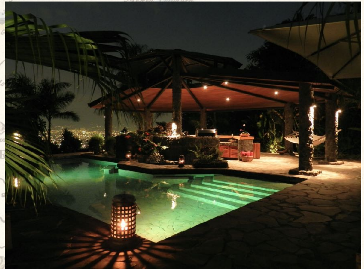
Equis I, Pool & Rancho

Aber für die, die wollen gilt: Gerne. Ab ins Wasser!