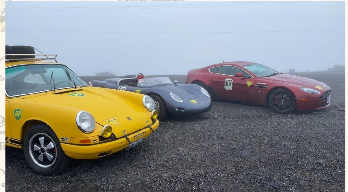
Vulkan Irazú, auf 3.430m über dem Meer.

Danach fahren wir durch die alte Hauptstadt Cartago in die Berge der Nordkordillere.