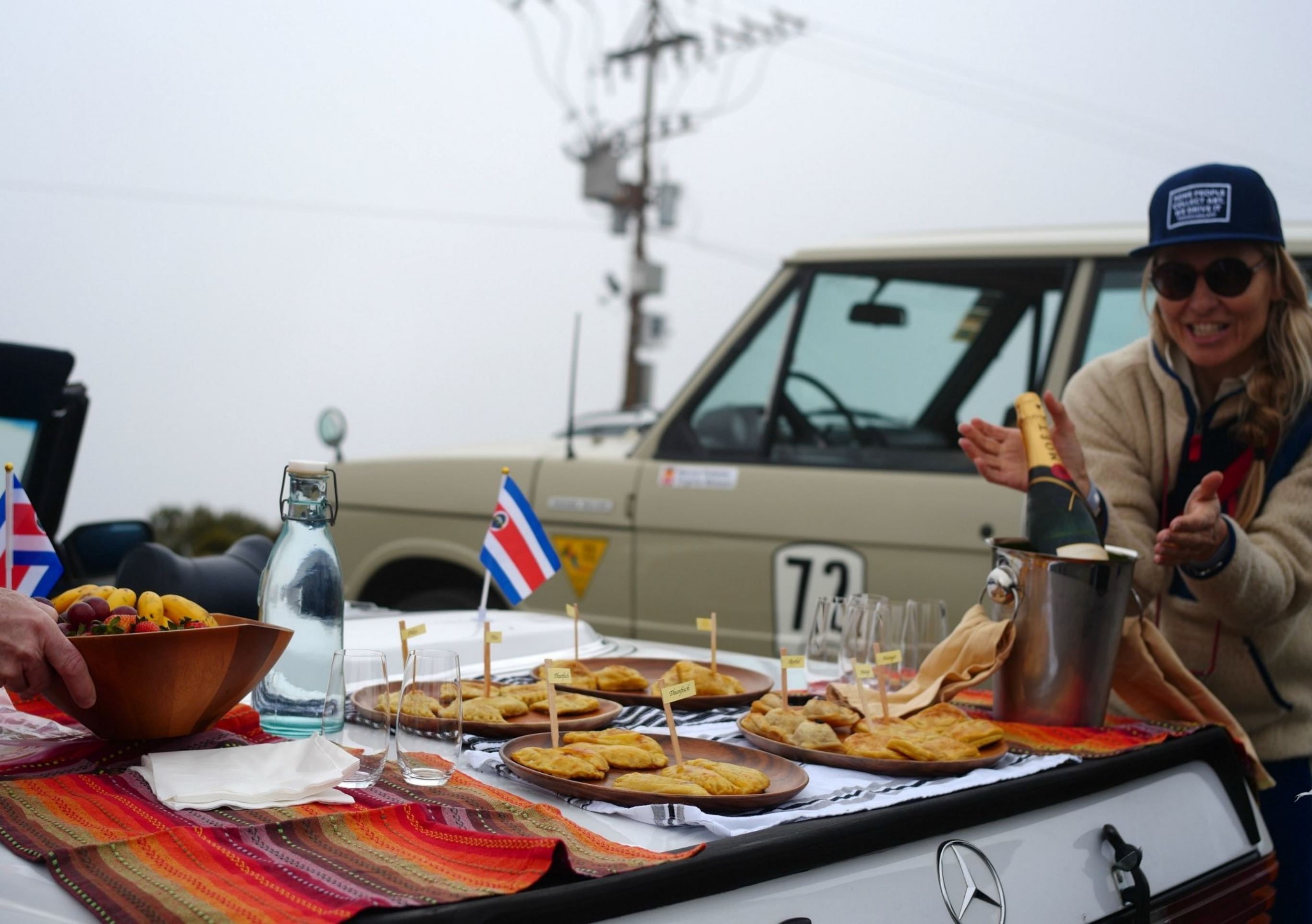
280 | 285 | 290 Brunch auf dem Vulkan Irazú. 3.430m über dem Meer. Recht erfrischend hier oben. Vorteil: Der Sekt bleibt länger kalt. Uitgeroerd te LEYDEN door PIETER VANDER AA met Privilegie . Seite 31 2 de Cortes Vervolg