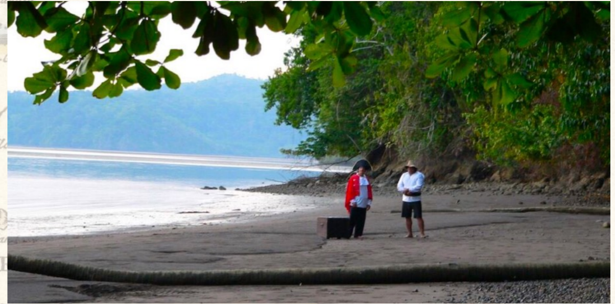
Bahia Equis II, Golfo Dulce

Am frühen Nachmittag kommen wir an. Am Golfo Dulce, dem Süssen Golf .