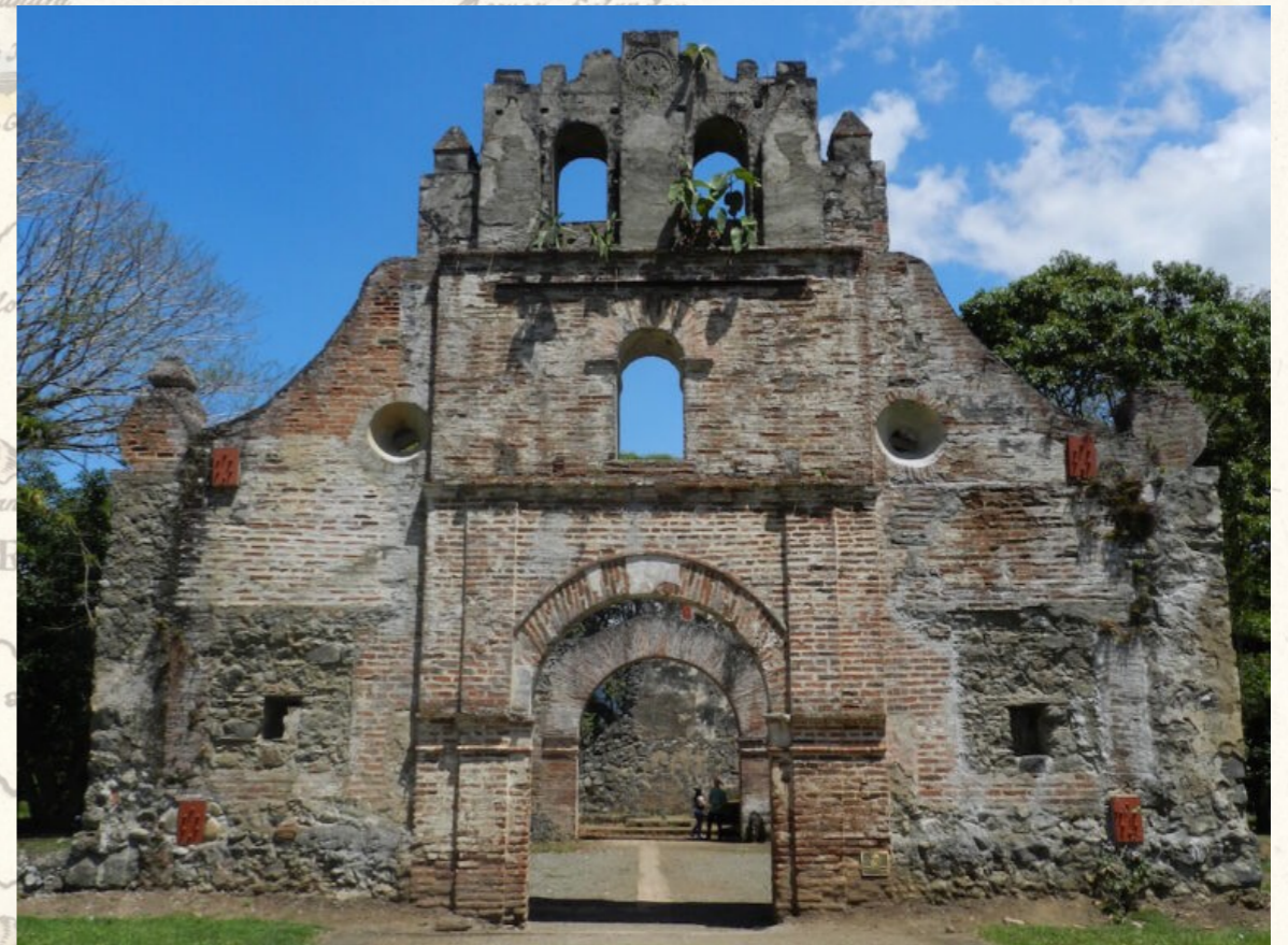
Ruinen von Ujarrás

Egal, für welches Ziel Sie sich entschieden haben, am frühen Nachmittag erreichen wir wieder unser Equis I. Mit Zeit um sich auf unser gemeinsames Abschieds-Dinner vorzubereiten. Aber vorher gilt die goldene Regel: Relax. Relax.