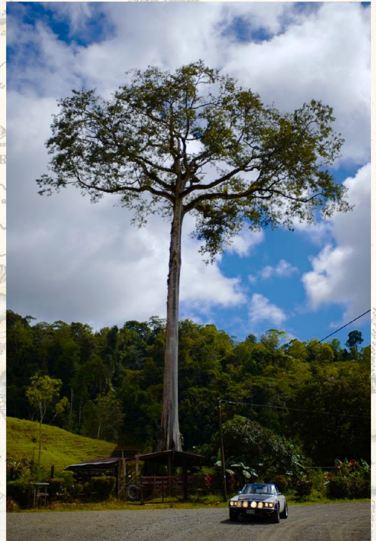
Kapokbaum (Ceiba) auf der Halbinsel Osa

Was gibt es Wertvolleres als unvergessliche Momente, pure Entspannung, Abenteuer und Natur zu genießen – in total entspannter, luxuriöser Atmosphäre?