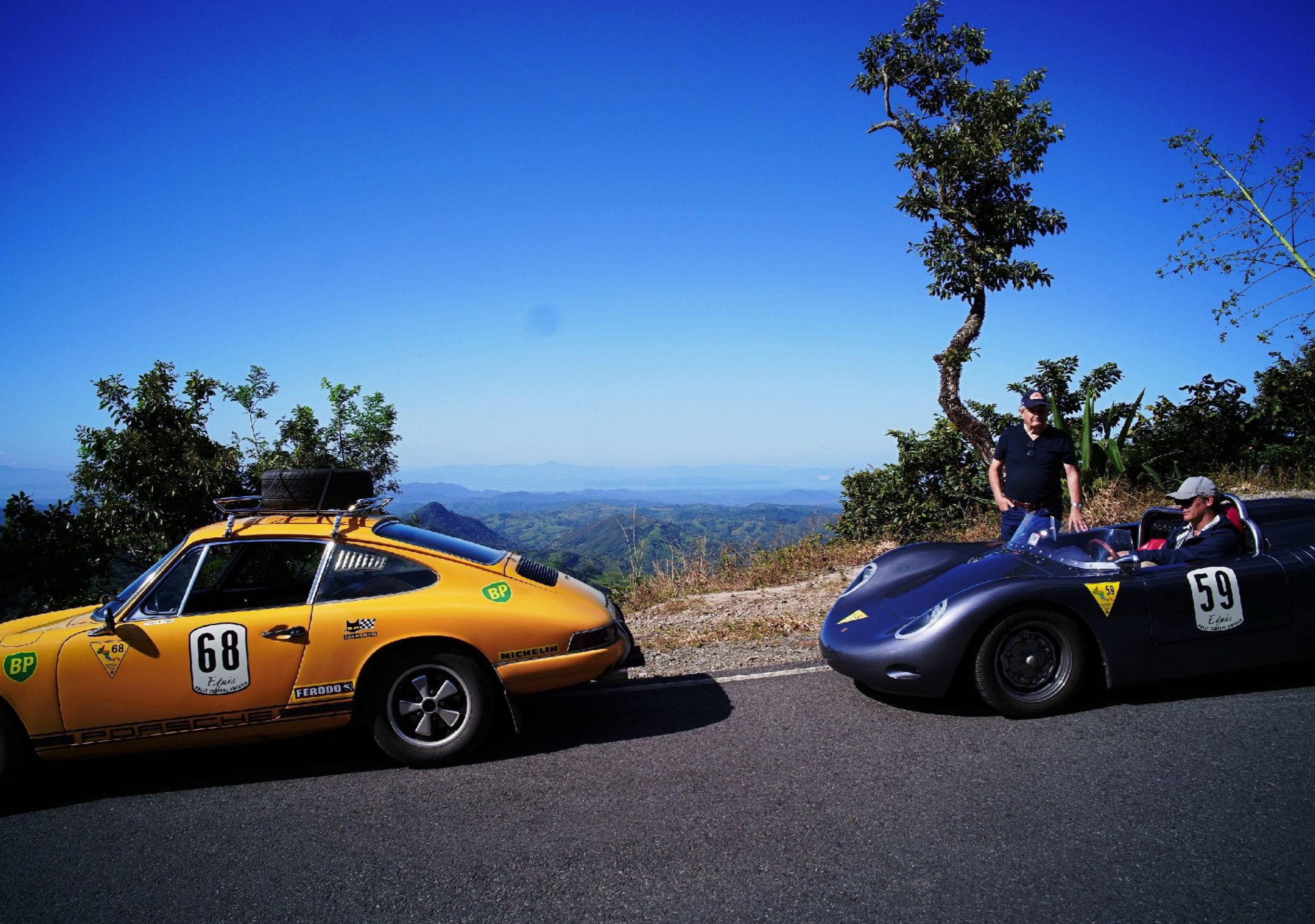
280 Die Berge von Monteverde. Im Hintergrund der Golf von Nicoya.