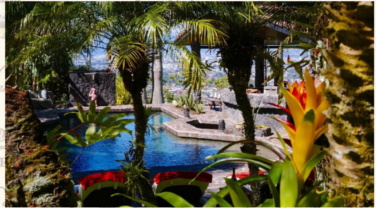
Poolarea - Equis I

Aber vor Abreise bitte noch am Pool entspannen.