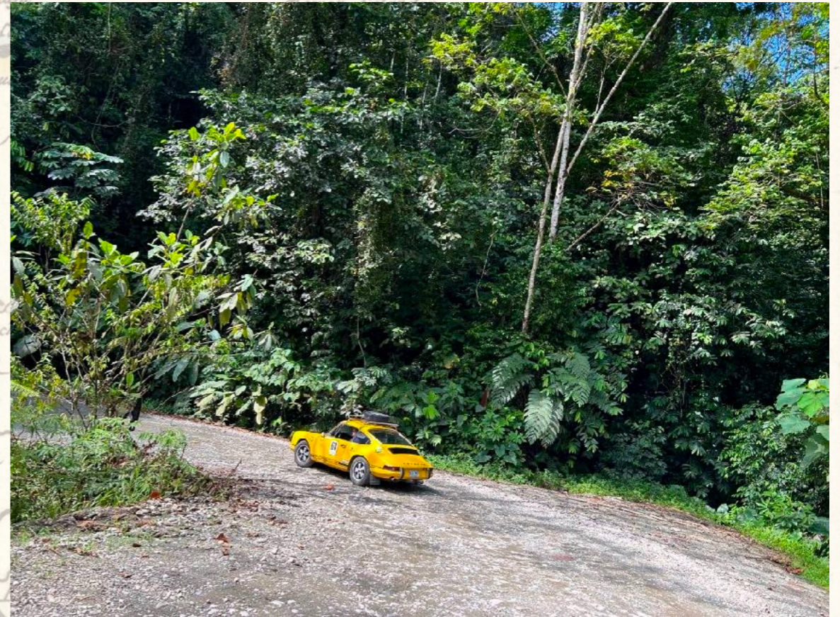
Osa, auf dem Weg zum Golfo Dulce

Die Gegend um San Vito wartet mit wunderschönen Nebelwäldern auf und die Blicke schweifen über die gesamte Tiefebene bis über den Pazifik und nach Panama hinein.