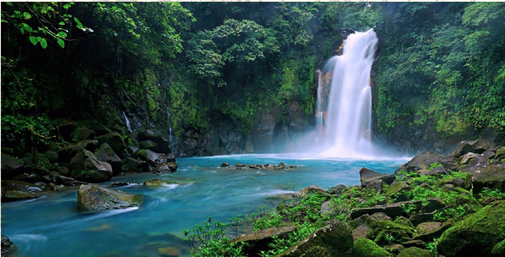
Wasserfall des Rio Celeste

Unsere Garantie: 100% südlich der Langeweile.