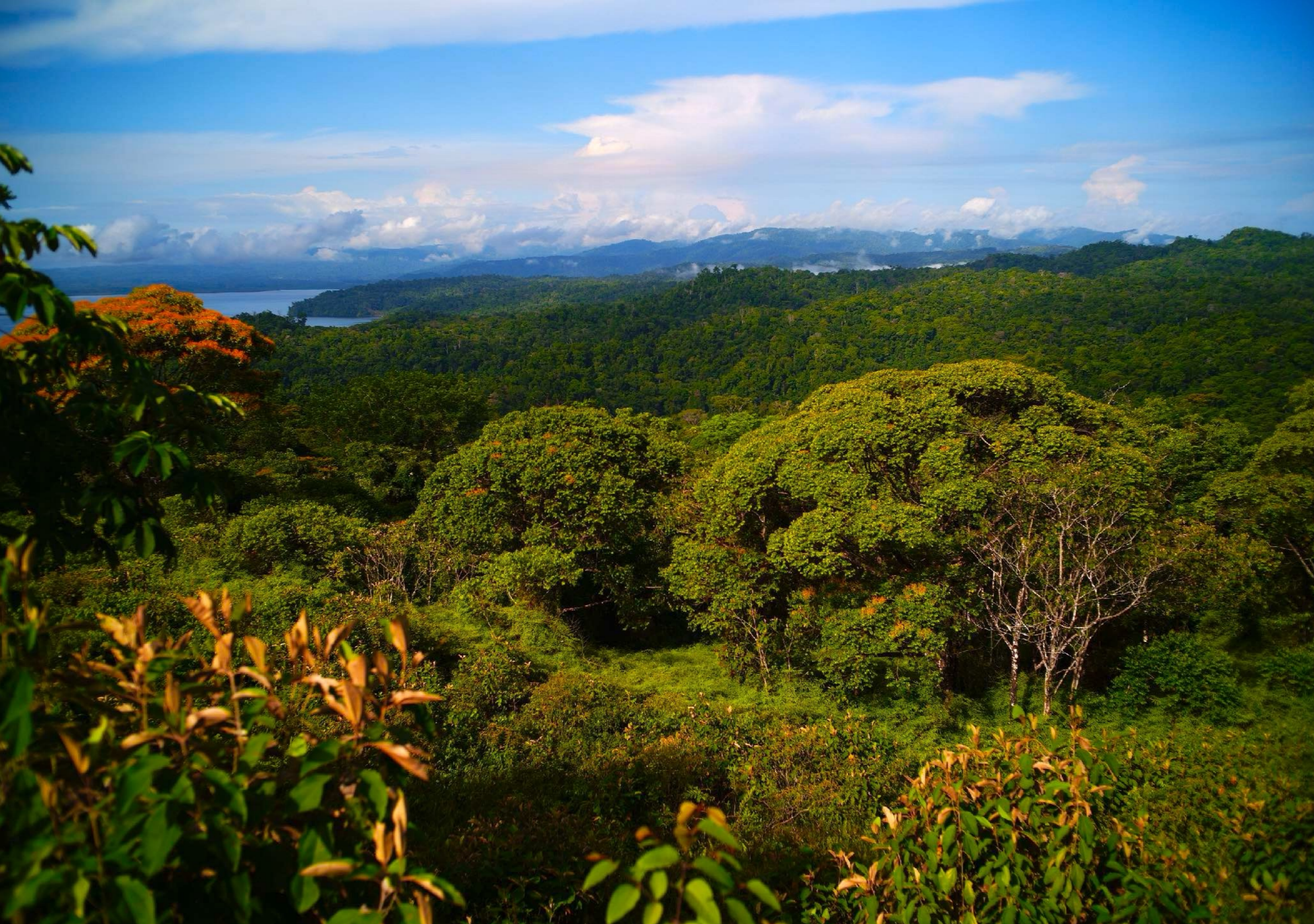
280 Primärwald mit Überständern, Halbinsel Osa, südliches Costa Rica. Im Hintergrund der Golfo Dulce. 285

Vytgeroerd te LEYDEN door PIETER VANDER AA met Privilegie .