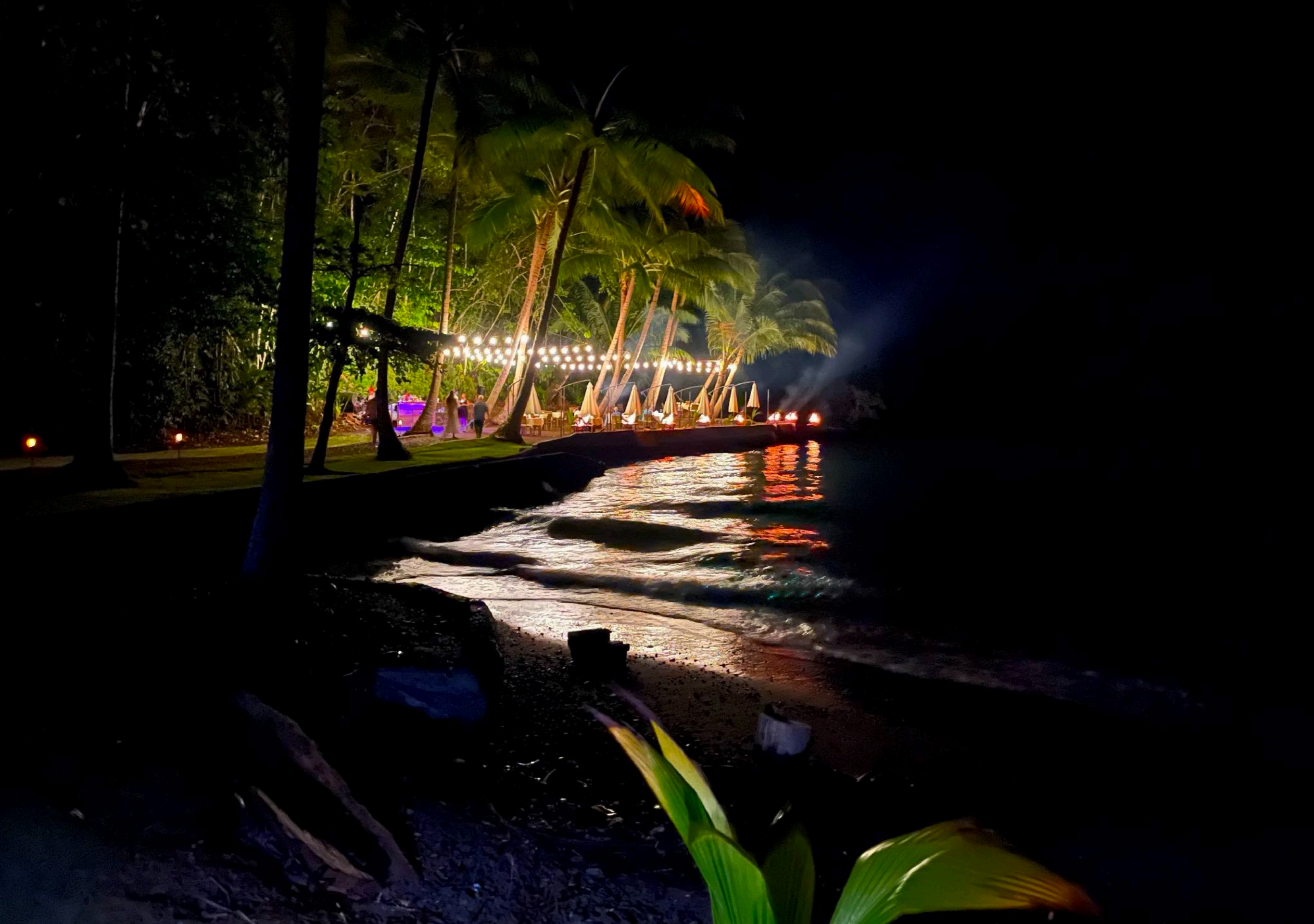
280 | 285 | 290 Wenn das Wetter mitspielt, lässt es sich zwischen Regenwald und Strand gut speisen. Kunken Lodge, Osa.