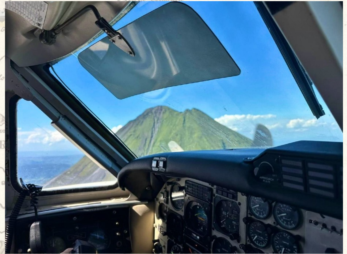
Vulkan Arenal - es geht aber noch näher ran.

Mit vollem Magen besichtigen wir dann etwas weiter in Orosí die älteste Kolonialkirche Costa Ricas mit angeschlossenem Museum und Kloster. Sie stammt aus dem Jahre 1743 und wird immer noch genutzt. Absolut sehenswert.