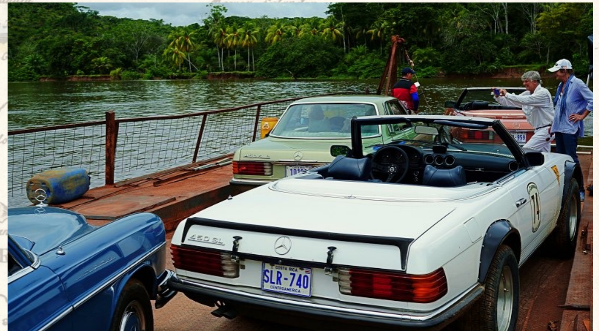
Unsere Fähre über den Rio Sirpe

Wenn Sie Ballermann und Benidorm mögen sollten, nun, dann wären Sie dort gut aufgehoben.