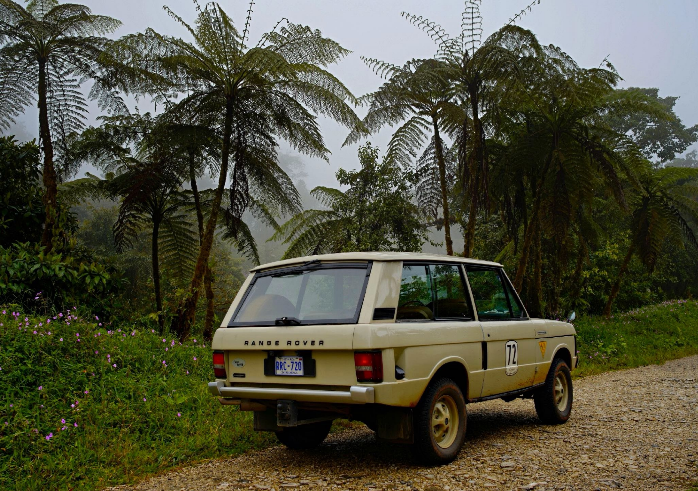
280 Nebelwald in der Nähe von San Vito, südliches Costa Rica.