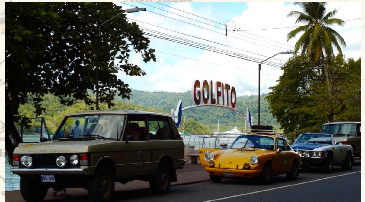
Mole von Golfito, im Hintergrund der Nationalpark Piedras Blancas

Sollten Sie ohne fahren, ist das absolut kein Problem.