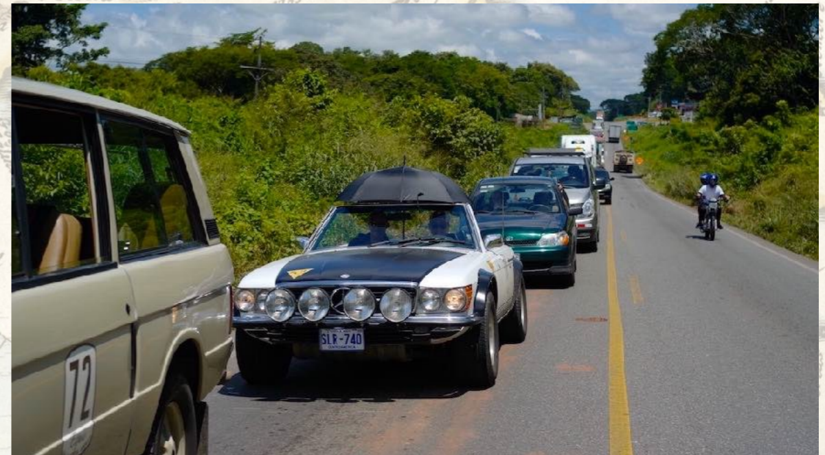
Bauarbeiten auf der Panamericana - und angewandter Pragmatismus