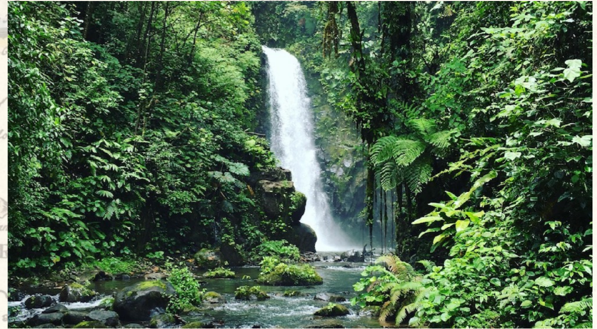
Einer der fünf Wasserfälle des La Paz Parkes