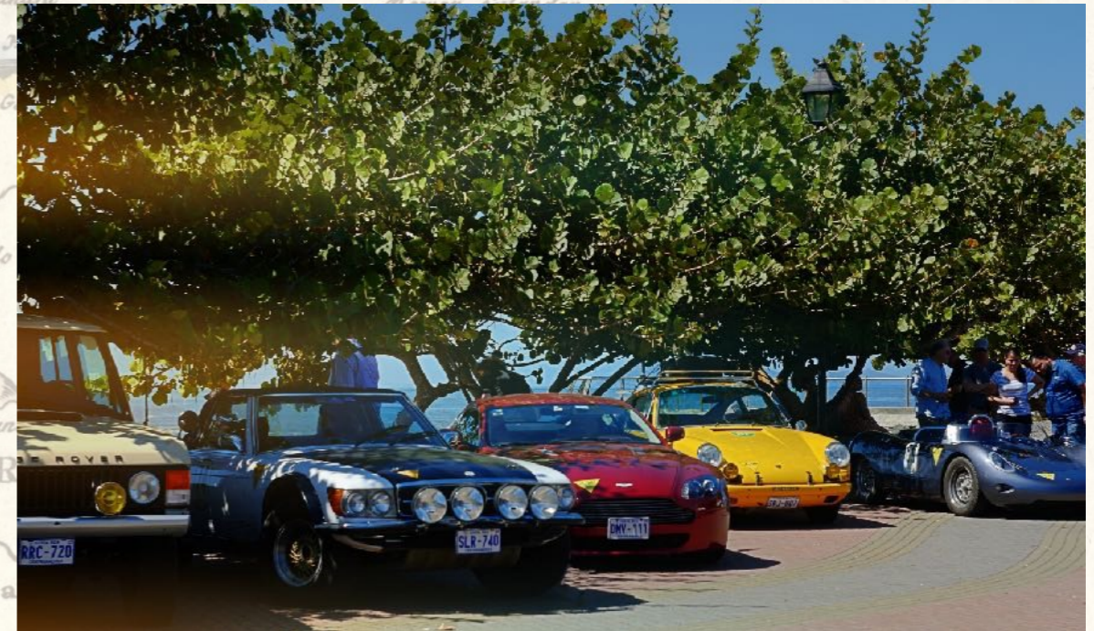
Hafenstädtchen am Pazifik, Puntarenas

Die Rallye Costa Rica kann aufgrund der klimatischen Bedingungen in Mittelamerika perfekt von Dezember bis September gefahren werden. Sie unterscheidet sich als Touring-Rallye-Urlaub grundlegend von „normalen“ Rallyes und ist i.d.R. auf 4 Fahrzeuge (plus Servicefahrzeug), begrenzt.