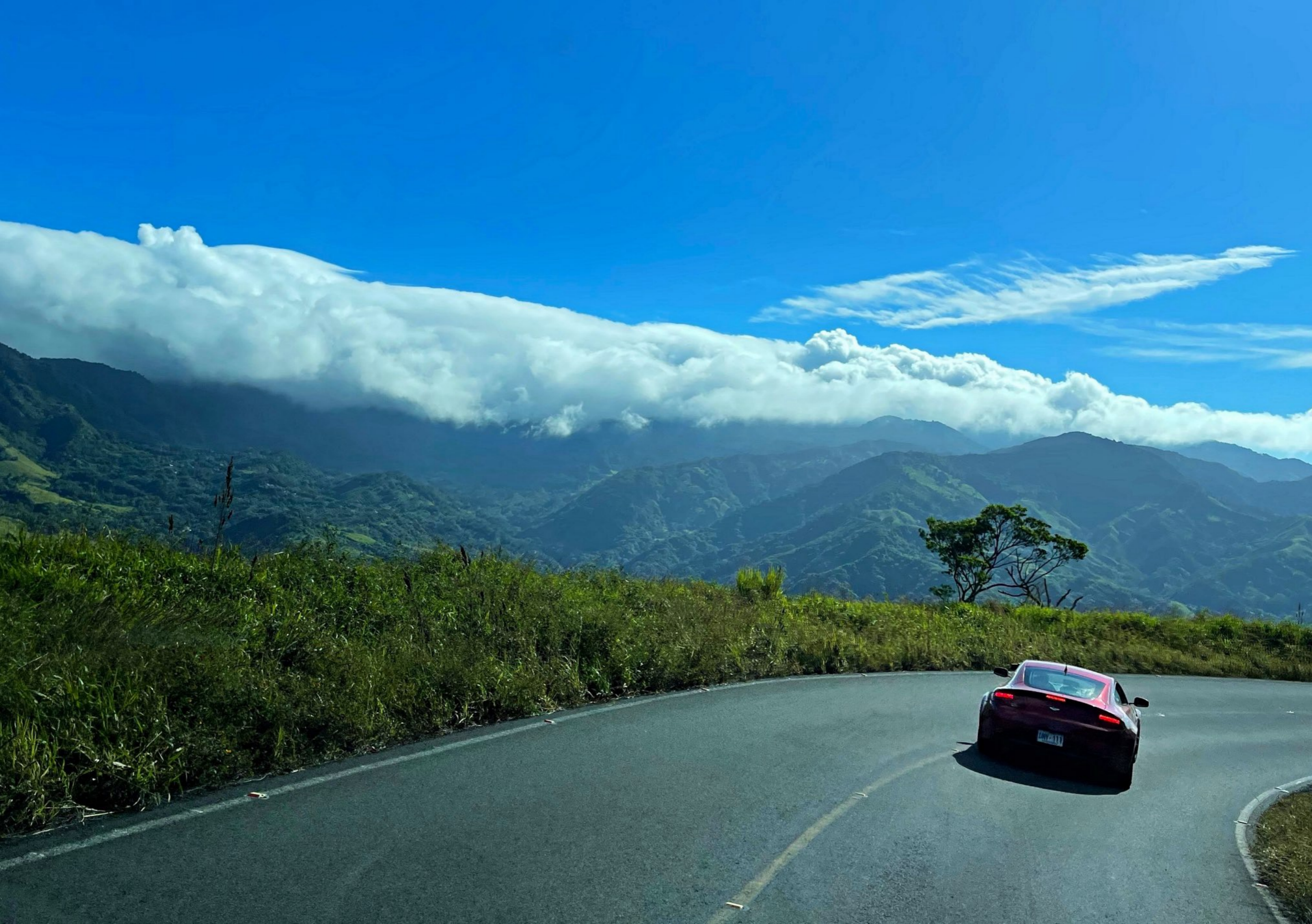
280 | Eines unserer Service-Fahrzeuge. Berge um San Vito, südliches Costa Rica. | 285

Vytgeroerd te LEYDEN door PIETER VANDER AA met Privilegie .