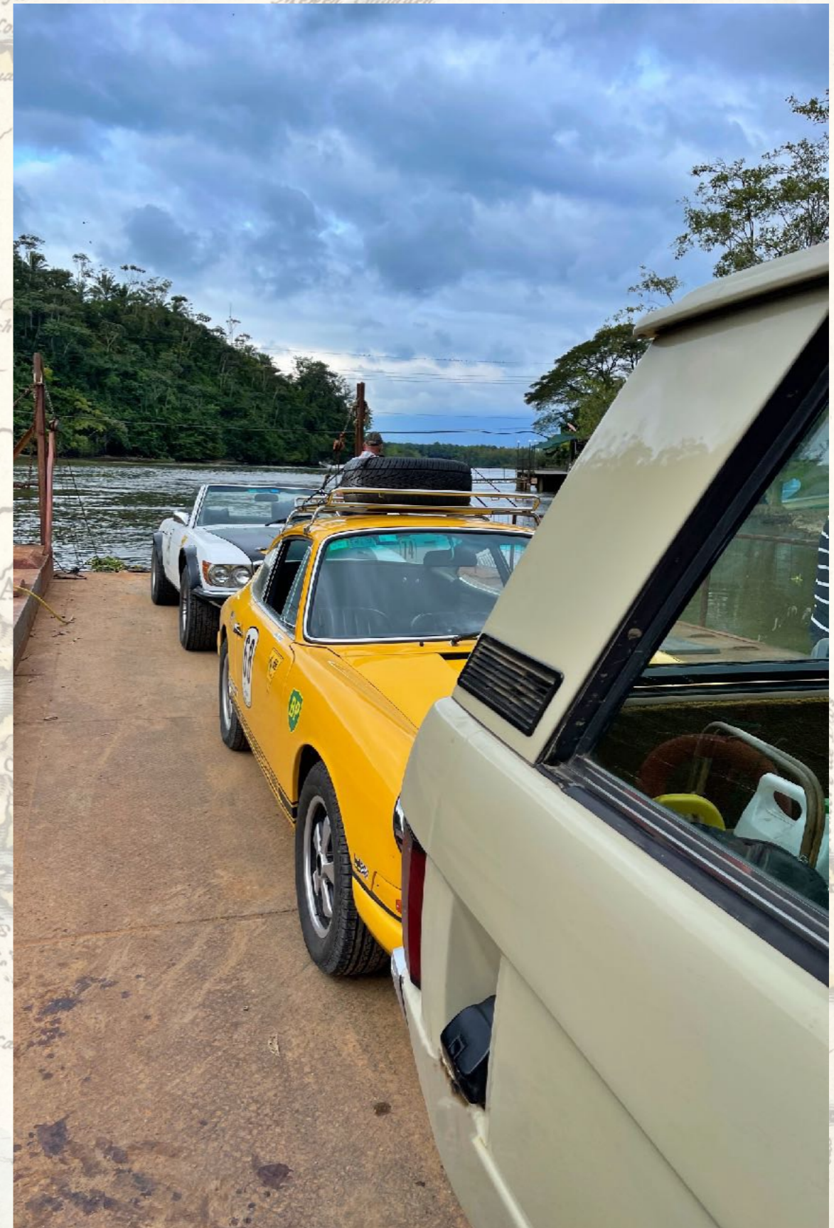
Urwaldfähre in Sierpe

Die folgenden Distanzen und Fahrtzeiten sind übrigens reine Circa-Angaben bei angenehmer Touring-Geschwindigkeit und beinhalten keine Zeiten für Aufenthalte bei Sehenswürdigkeiten, Tank-Stopps und Mahlzeiten.