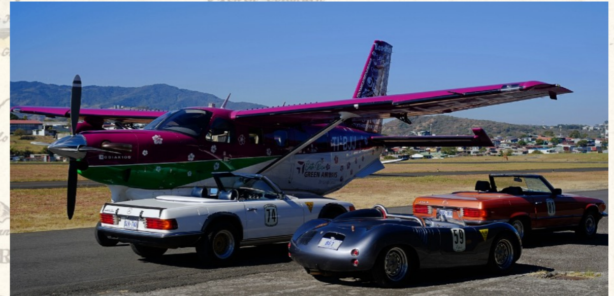
Umsteigen auf die ganz unkomplizierte Art.

Oder kombinieren Sie Pool-Tag mit der Erkundung von San José, die Möglichkeiten sind vielfältig.