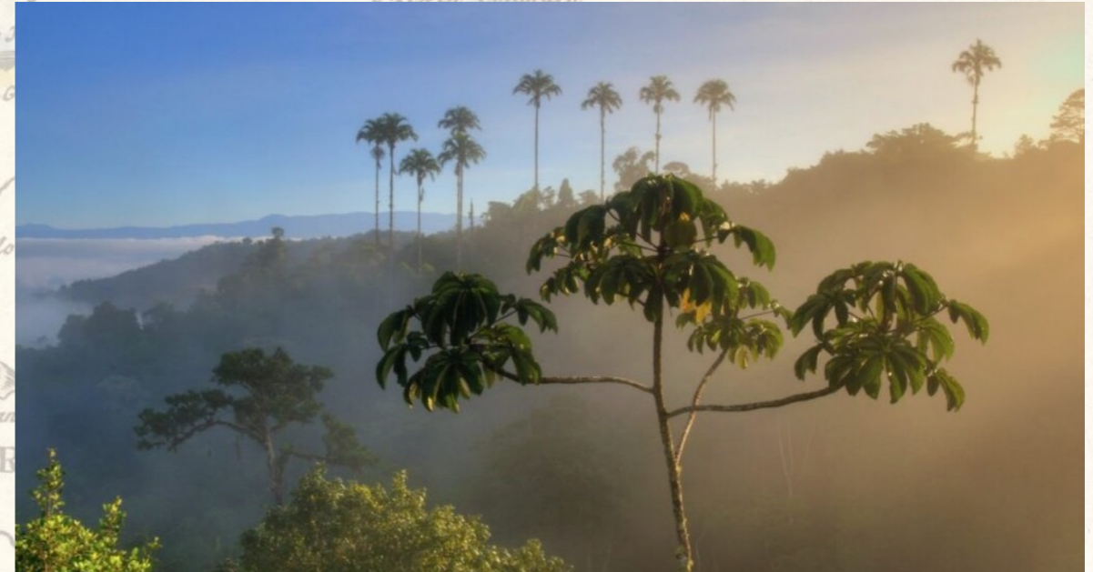
San Vito, südliches Costa Rica

Vor Jahrhunderten sind Bergwanderer regelmäßig oben in Gipfelnähe erfroren, sie waren einfach nicht auf die über 3.000m herrschenden Temperaturen vorbereitet.