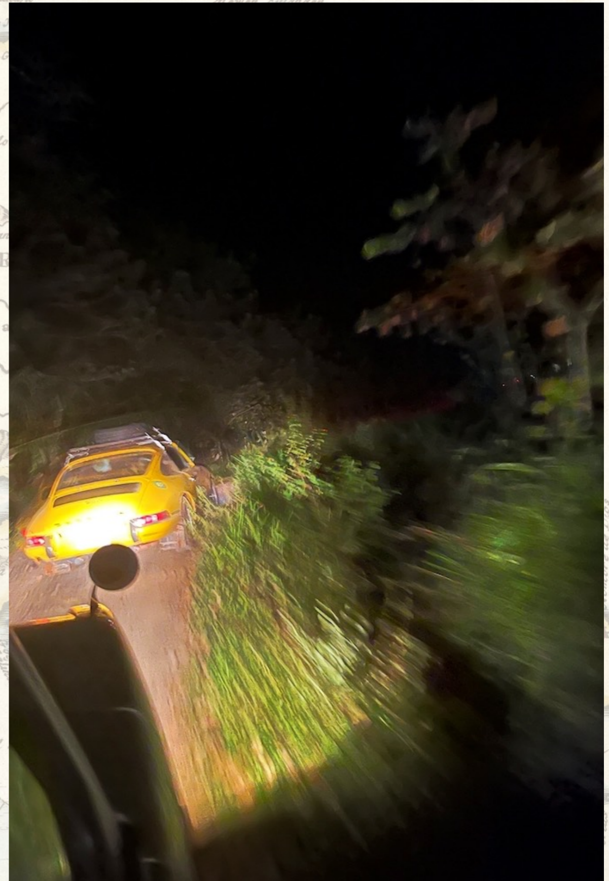
Keine Nachtfahrten. Ausnahmen bestätigen die Regel.

Bitte fragen Sie uns zu den Restaurants, wir geben unsere Erfahrungen gerne an Sie weiter.