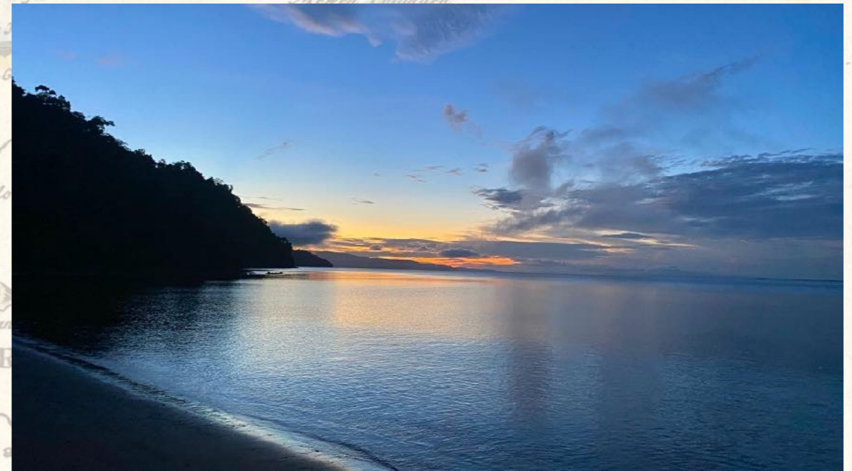
Strand der Kunken Lodge, Golfo Dulce

Wir könnten übrigens auch einen kurzen Abstecher zum alten Goldgräberort Puerto Jiménez machen, man kann dort in der Regel wunderbar Affen, Tukane und Aras beobachten, die sich auch gerne mal genau über unseren Gästen „verstecken“.