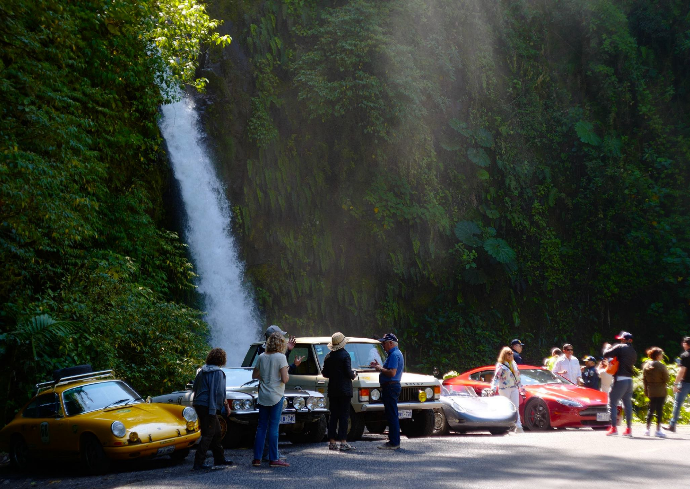
285 | 285 | 290 Wo die alten Autos auftauchen, werden Fotos gemacht. Costa-Ricaner lieben Old- und Youngtimer.

Voyageroerd te LEYDEN door PIETER VANDER AA met Privilegie .