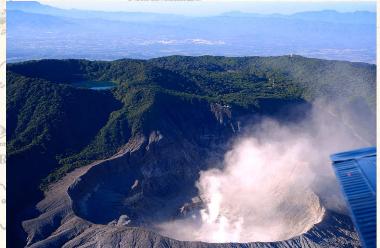
Vulkan Póas: Hauptkrater und Kratersee.